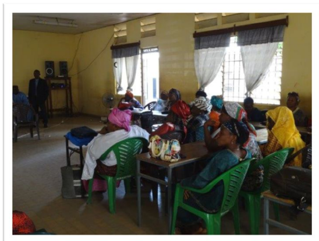
Débats en plénière avec les VV

Projet « Espaces et outils pour une gestion durable des ressources naturelles en Basse Guinée »