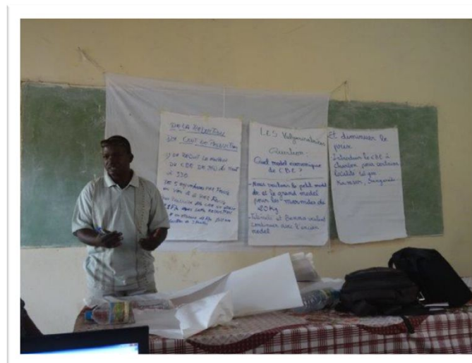
Restitution des travaux de groupe par le rapporteur des PME