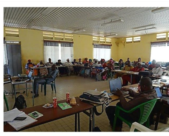
Amendements en plénière des rapports de synthèse quotidiens