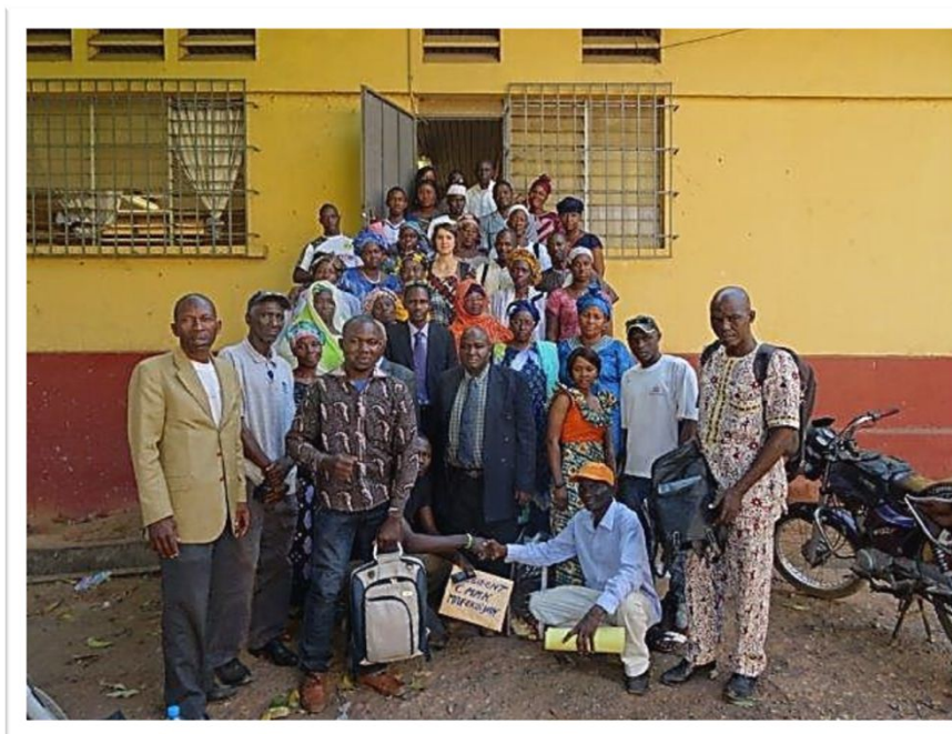
Clôture de l'atelier le 29 janvier 2015