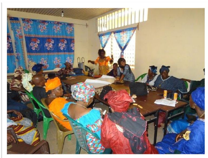
Travaux en sous-groupes

Projet « Espaces et outils pour une gestion durable des ressources naturelles en Basse Guinée »