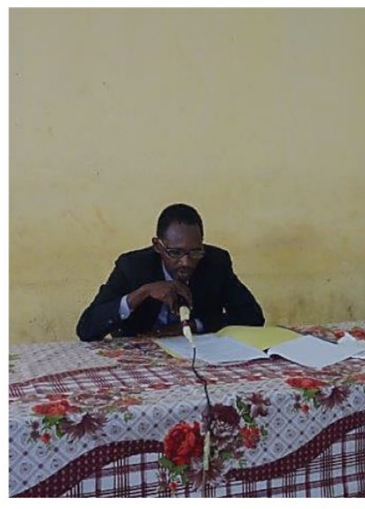
Discours de clôture par le représentant de la Division des Energies renouvelables du Ministère de l'Energie et de l'Hydraulique