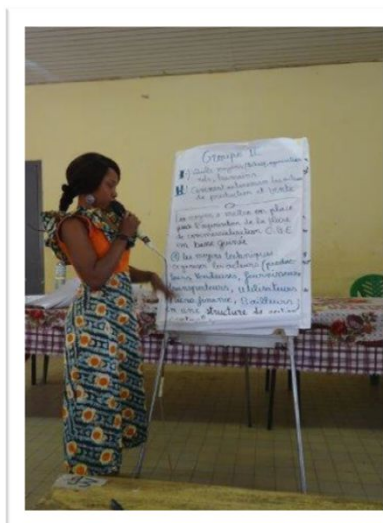
Restitution des travaux de groupe par la rapporteuse des VV